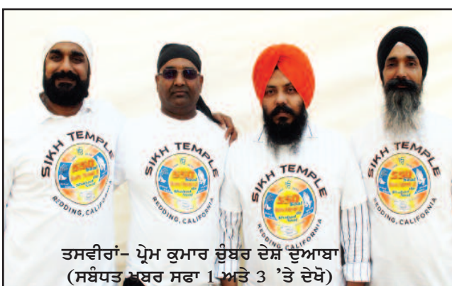
(ਸਬੰਧਤ ਮੁੱਢਲੇ ਸਫਾ 1 ਅਤੇ 3 'ਤੇ ਦੇਖੋ)